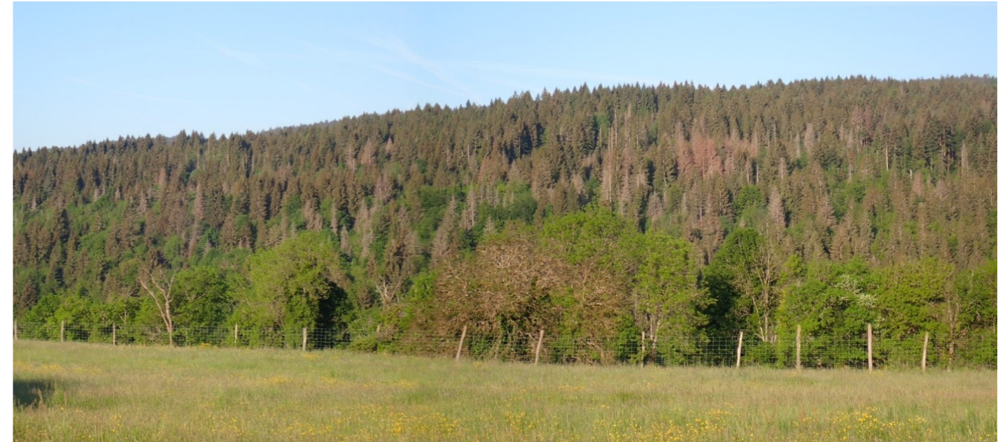
Le bois de Puthod et ses « taches » d'épicéa séchés.

Notre forêt est actuellement en crise sanitaire. Chacun en regardant le Bois de Puthod voit les épicéas séchés que les coupes forestières ne parviennent pas à éliminer à temps. Les derniers épisodes de sécheresse estivale ont multiplié les attaques de scolytes. Les épicéas séchent. Beaucoup sont malgré tout vendus en urgence. La forte demande en bois leur donne encore une valeur marchande même si celle-ci a baissé.