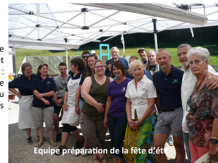
Equipe préparation de la fête d'été

Toutes ces activités sont réalisées grâce à l'équipe d'animation qui continue de proposer et d'organiser des activités d'animation sur l'année : concours de belote, marathon VTT, fête d'été de juin et son feu d'artifice, journée galettes au feu de bois, soirée cabaret et bien sûr le repas des anciens.