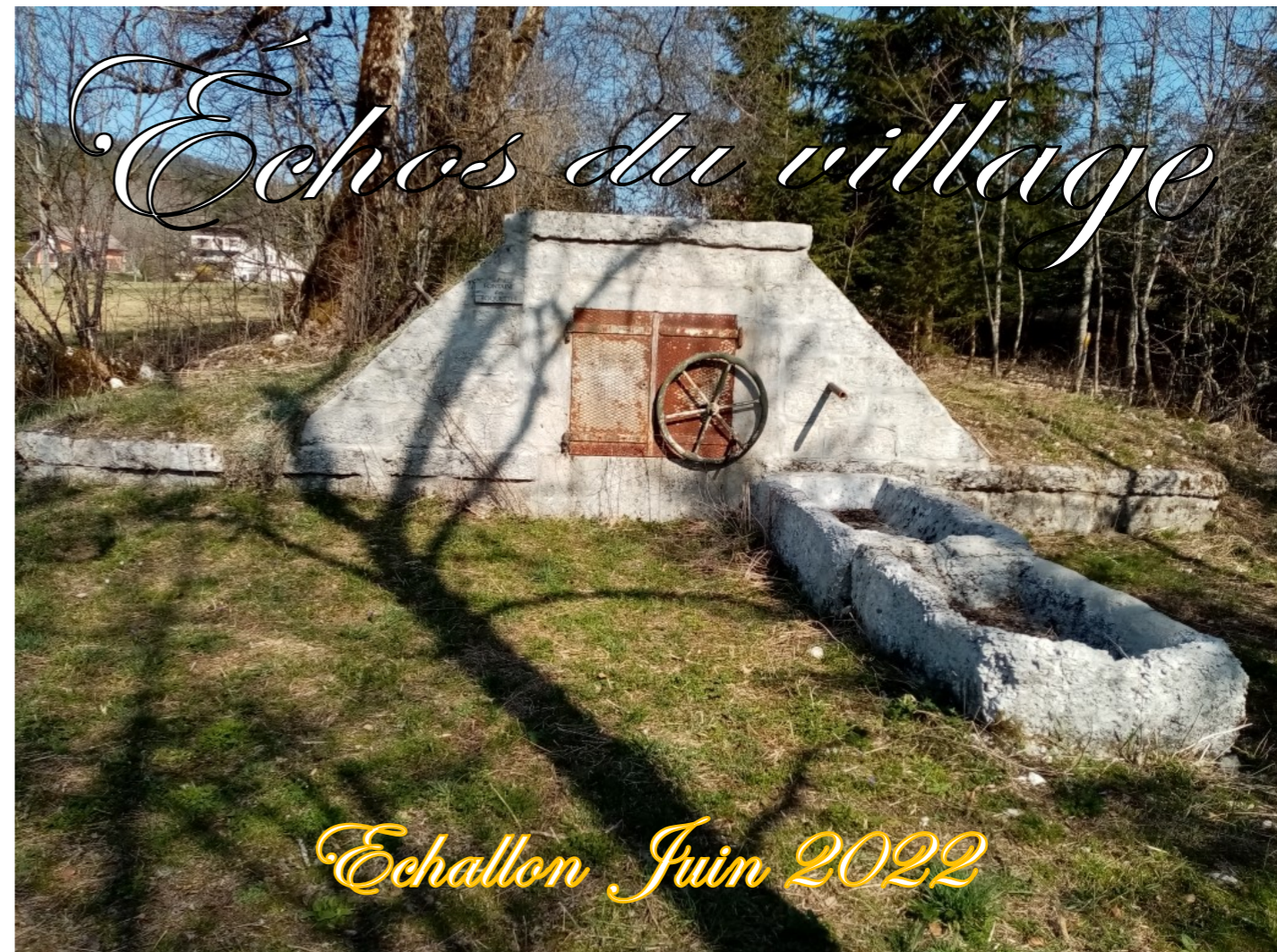
Fontaine de la Roquette