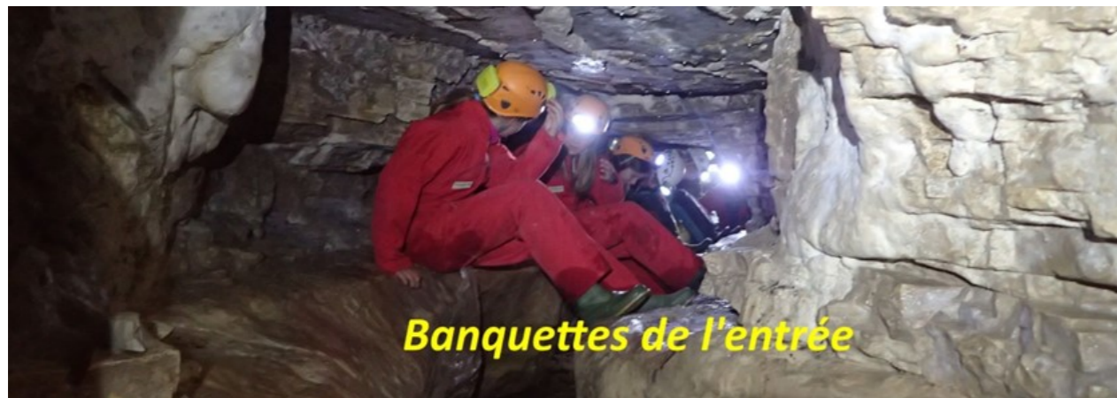
Banquettes de l'entrée

L'explo s'arrêtera tout de suite : la suite est trop étroite. En 2001 le SCS, le club d'Echallon reprendra du côté « laminoir impénétrable » qu'ils agrandiront sur quelques mètres. La suite est une galerie d'abord basse et boueuse, puis haute, montante et fracturée. L'élargissement de l'étranglement final permettra d'atteindre une jolie salle ronde de 12 m de haut. L'escalade de celle-ci montrera qu'elle est coupée en haut par une diaclase impénétrable. Le développement de la cavité est maintenant de 340 m.